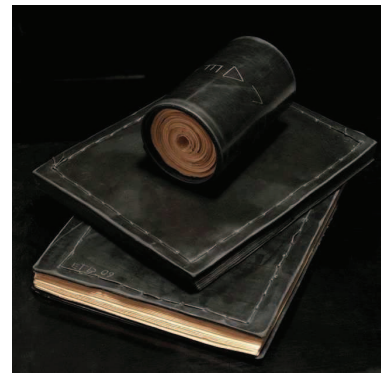
EVA TOURTOGLOU BONY Livre 8. 1930 Caoutchouc, livre fil, 2010 26 x 18,5 cm. © Eva Tourtoglou Bony