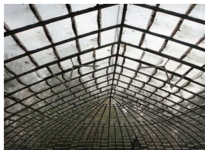
JEAN-JACQUES DOURNON La serre de Nostradamus Installation au Château de Roussan, Saint-Rémy-de-Provence © Jean-Jacques Dournon