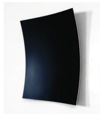
HEINER THIEL Sans titre , 2010 Aluminium anodisé, 60 x 60 x 15 cm © Heiner Thiel