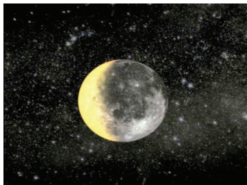
ROSELINE DELACOUR De notre galaxie au cerveau , octobre 2009 Vidéo 3D © Roseline Delacour