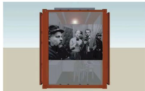
PABLO GARCIA Hétéropie , projet pour un Container, 2011 © Pablo Garcia