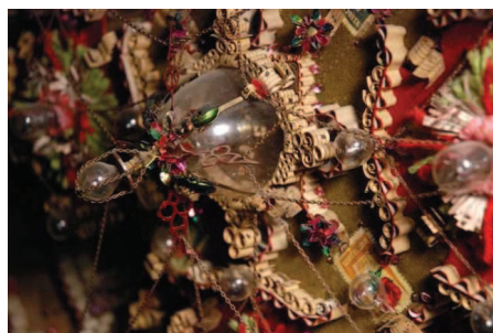
FRED GAUTRON Mandala Installation, technique mixte 2011 © Fred Gautron