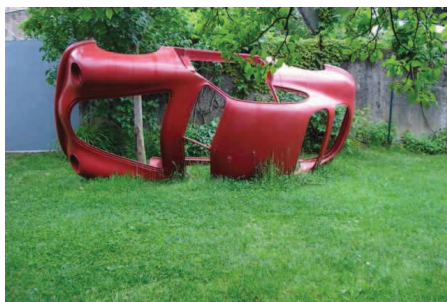
ÉTIENNE BOSSUT Ruine , 2007 390 x 165 x 115 cm