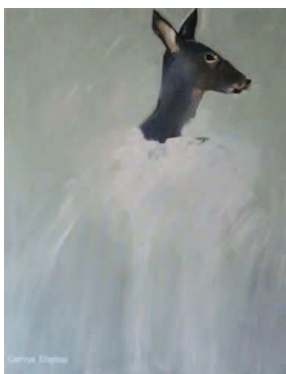
CORINE FERTÉ Cervus Elaphus Huile sur toile, 2011 160 x 140 cm © Corine Ferté