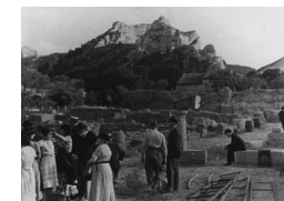
Les fouilles en 1936

Les premiers habitants s’installent aux VIII e et VI e siècles avant J.-C., à l’abri d’un rempart en pierres sèches qui ferme la voie des Alpilles sur 300 mètres de long. Des poteries et des monnaies jetées en offrande dans l’aven* surplombant la source témoignent de la motivation religieuse, dès l’origine, de cette implantation gauloise. Un dieu celte, Glan, et ses compagnes bienfaitrices, les Mères glaniques, habitent ces eaux réputées guérisseuses et donnent leur nom aux habitants.